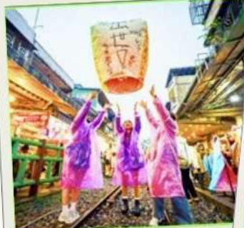
ปล่อยโคมลอย