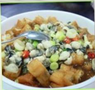
ถนนโบราณสี่เฟิ่น