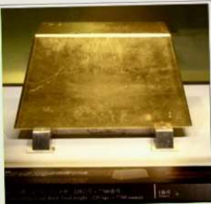
พิพิธภัณฑ์ทองคำ