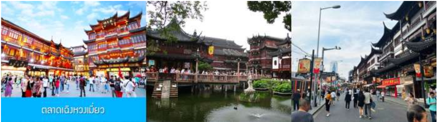
ตลาดเจิงหวงเมี่ยว

เช้า รับประทานอาหารเช้า ณ ห้องอาหารของโรงแรม (6)