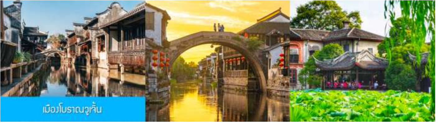
เมืองโบราณวูเจิน