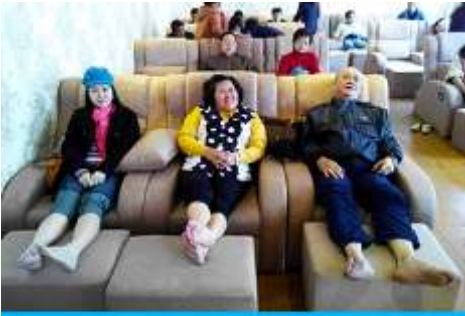
ศูนย์วิจัยแพทยแผนจีน