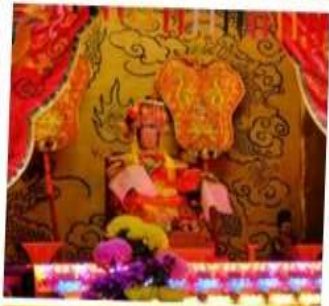
เจ้าแม่ทับทิม จอสเฮาส์เบย์