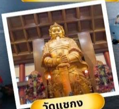
วัดเขากง