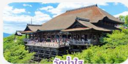
วัดน้ำใส