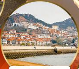
ซาจี้โข่ว