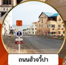
ถนนอ่าวจีป่า