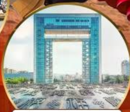
ประตู่แห่งความสุข