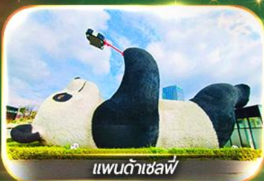
แพนด้าเซลฟ์