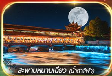
สะพานหนานเจียว (น้ำตาสีฟ้า)