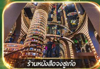
ร้านหนังสือจงซูเกอ

เที่ยวชม 2 อุทยาน ปี้เฟิงโกว & จิวจ้ายโกว (รถเหมา)