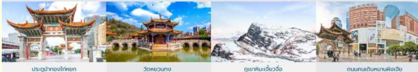
ประตูม้าทองโก่หยก