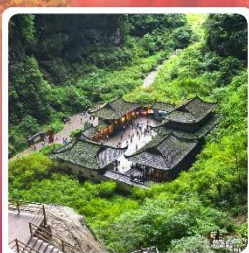
หลุมบ่อฟ้า