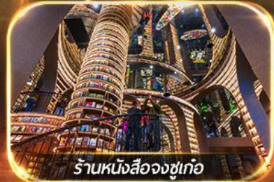
ร้านหนังสือจงซูเท่อ

เที่ยวชมทัศนียภาพ 2 อุทยาน ปี้เฟิงโกว & ชวงเจียวโกว