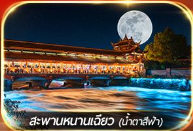
สะพานหนานเจียว (น้ำตาสีฟ้า)