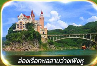
ล่องเรือทะเลสาบว่างเฟิงหู