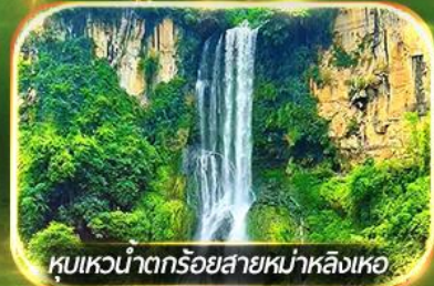
หุบเขาน้ำตกร้อยสายหม่าหลิงเหอ

ชมป่าภูเขาหมื่นยอด, เที่ยวหมู่บ้านโบราณหลินปู้อี ล่องเรือทะเลสาบว่างเฟิงหู, ชมสวนดอกไม้ตามฤดูกาล