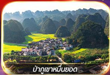
ป่าภูเขาหมื่นยอด