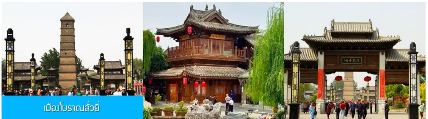
เมืองโบราณฉวี่หยี่

16.18 น. ขบวนรถไฟนำคณะเดินทางถึงสถานีรถไฟนครฉวี่หยาง นำคณะขึ้นรถบัสเพื่อเดินทางสู่นครฉวี่หยาง