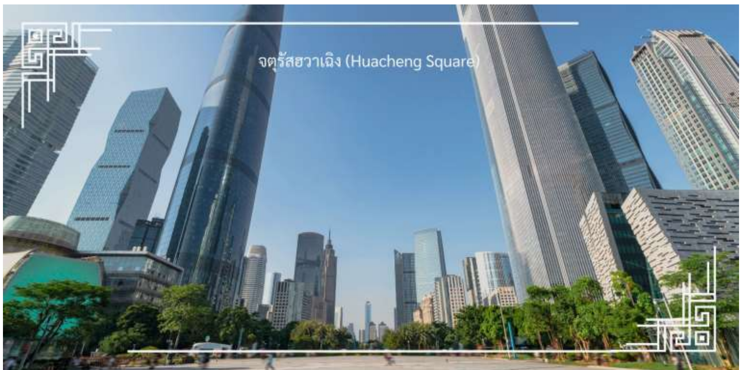
จตุรัสฮวาเฉิง (Huacheng Square)

ท่านชม จตุรัสฮวาเฉิง (Huacheng Square) หรือที่มีความหมายว่า “จัตุรัสดอกไม้” แลนด์มาร์กสำคัญใจกลางเมือง กวางโจว ที่ผสมผสานความรื่นรมย์ของธรรมชาติเข้ากับความทันสมัยของเมืองได้อย่างลงตัว บรรยากาศโดยรอบมีความร่ม