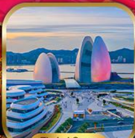
Zuhai Opera House