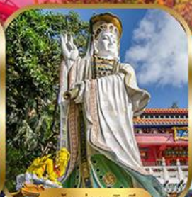
เจ้าแม่กวนอิมรีพลัสเบย์