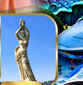
จูไห่พิชเชอร์ทีรา