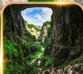
อุทยานหลุมฟ้า 3 สะพานสวรรค์