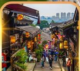
หมู่บ้านโบราณฉือซือโจว