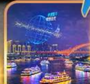
ส่องเรือแม่น้ำแยงซีเกียง