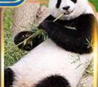
สวนสัตว์จงชิ่ง