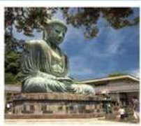
วัดโศโตคุอิน

SHIRAKAWAGO JAPAN ALPS MATSUMOTO KAMIKOCHI FUJI KAMAKURA