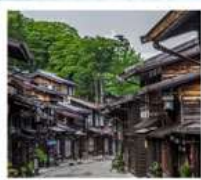
หมู่บ้านโบราณนารายิ จุกุ

หมู่บ้านมรดกโลก ชิราคาว่าโกะ / ซินมาจิ ซูจิ / ตลาดฮาชิมายาทาวะ ท่าแพงหิมะเจแปนแอลป์ / คามิโกจิ สะพานคัปโปะ / หมู่บ้านโบราณนารายิ จุกุ สวนโออิชิ ปาร์ค / ทะเลสาบโมโตสุ ทุ่งพืชมอส / วัดฮาเซดะระ / วัดโศโตคุอิน ศาลเจ้าเนซุ / ห้างเซ็งเคียว บันโร / ซอปปิ้งชินจูกุ