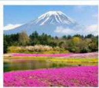
ทะเลสาบโมโตสุ ทุ่งพืชมอส