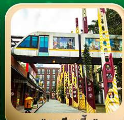
“ตงเจียวจื่อ”