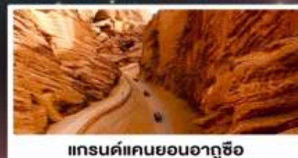
แกรนด์แคนยอนอาถูซือ