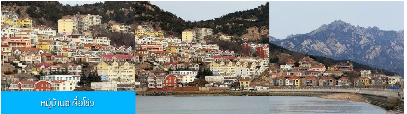
หมู่บ้านซาจื่อโขว่

เที่ยง รับประทานอาหารกลางวัน ณ ภัตตาคาร (มื้อที่ 7)