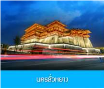
นครลำพอง