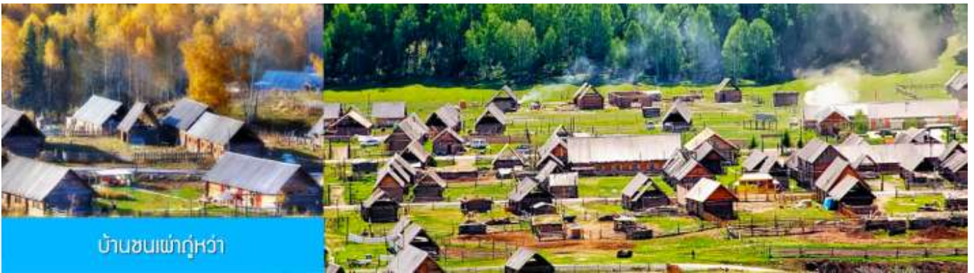
บ้านชนเผ่าทู่หว่า

หลังอาหารนำท่านเดินทางสู่ หมู่บ้านหอมู่ซุน (ระยะทาง 110 กม ใช้เวลาเดินทางราว 2 ชั่วโมง) นำท่านเที่ยวชม หมู่บ้านหอมู่ซุน 禾木村 หมู่บ้านโบราณที่ขึ้นชื่อด้วยทัศนียภาพที่สวยงามท่ามกลางความสงบ เป็นชุมชนของชนเผ่าทู่หว่าที่เป็นชนพื้นเมืองในเขตมองโกเลีย ที่เป็นชนกลุ่มน้อยที่เก่าแก่ที่สุดในจีนพำนักอาศัยอยู่ หมู่บ้านแห่งนี้ ตั้งอยู่ในเขตอุทยานคานาสีอ ทางฝั่งตะวันตกเฉียงใต้ของเทือกเขาอัลไต หมู่บ้านนี้ได้รับการขนานนามว่าเป็นหมู่บ้านชนเผ่าที่มีเอกลักษณ์โดดเด่น ถูกจัดลำดับเป็นหนึ่งในหกหมู่บ้าน โบราณที่ดีที่สุดในหนึ่งแปดสถานที่ถ่ายทำภาพยนตร์ยอดเยี่ยมของจีน มีแม่น้ำหอมู่ไหลผ่านหมู่บ้าน ด้วยทัศนียภาพที่สวยงามท่ามกลางความสงบแห่งธรรมชาติ หมู่บ้านแห่งนี้มีช่างภาพ นักวาดเขียนและนักท่องเที่ยวต่างมาเยือนอย่างไม่