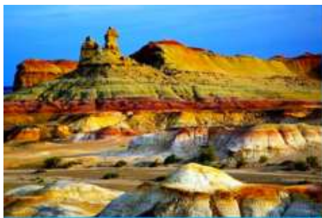
เมืองพิวูเอ้อเหอ

พักที่ XI BU WU ZHEN HOTEL ระดับ 4 ดาวท้องถิ่นหรือเทียบเท่าในเมืองวูเอ้อเหอ