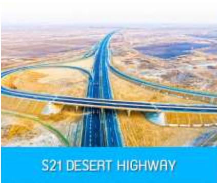
S21 DESERT HIGHWAY