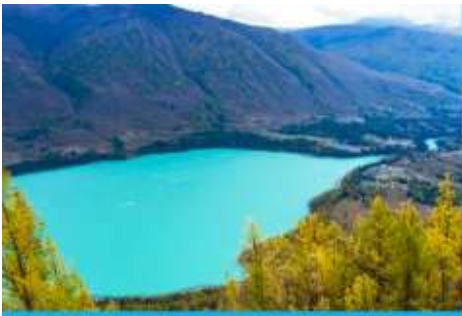
ศาลาชมปลา