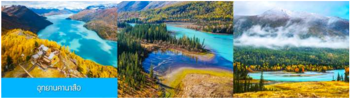
อุทยานคานาสือ