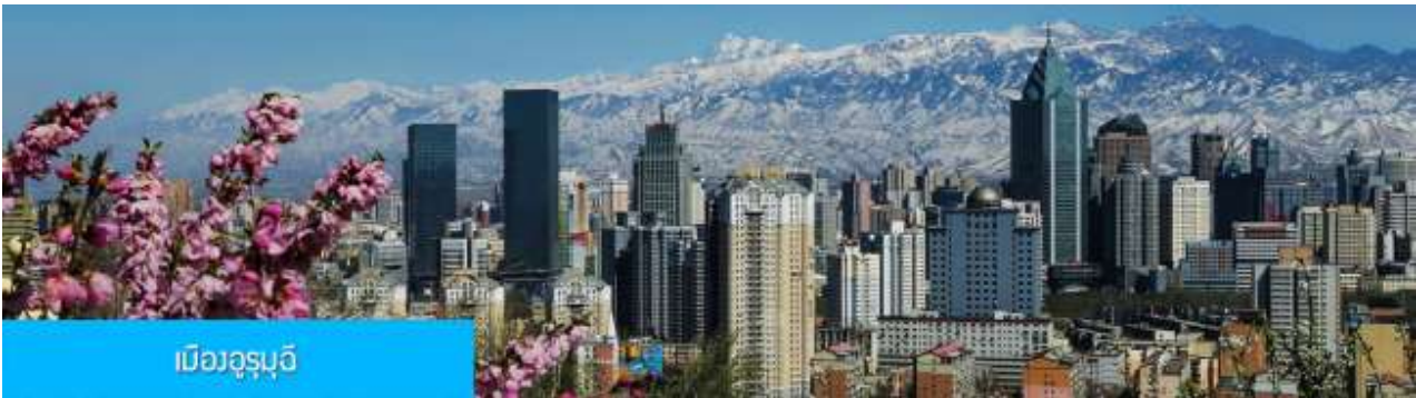
เมืองอูรูมฉี

พักที่ MERCURE HOTEL โรงแรมระดับ 4 ดาวท้องถิ่นหรือเทียบเท่าในเมืองอูรูมฉี