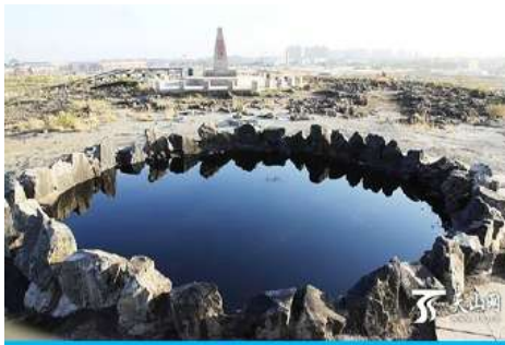
บ่อน้ำมันสีดำ

ระหว่างทางแวะรับประทานอาหารกลางวัน ณ ภัตตาคาร (เมนูอาหาร 80 หยวน/หัว) (11)