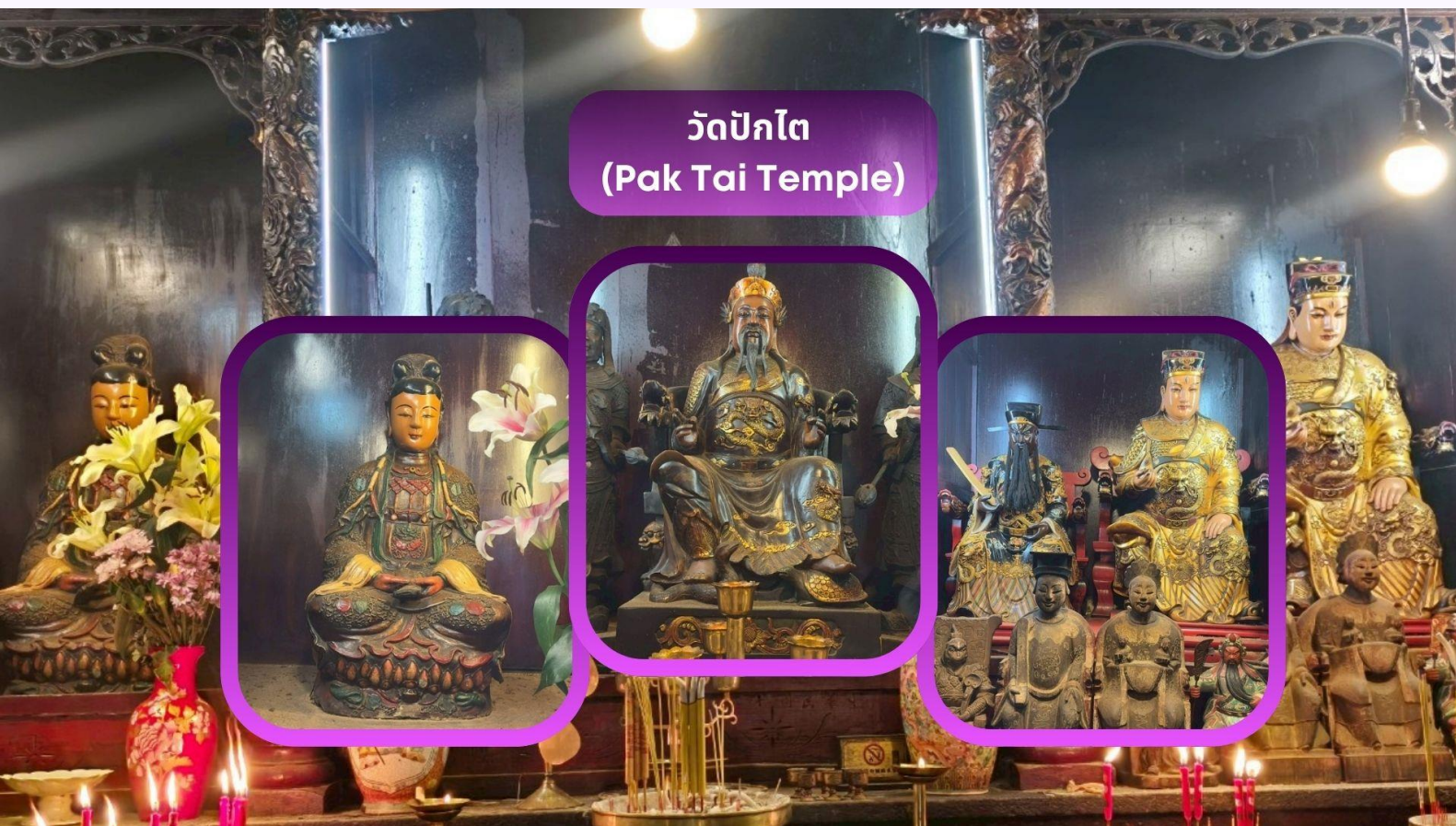
วัดปักไต (Pak Tai Temple)

นำท่านเดินทางสู่ วัดปักไตฮ่องฮำ (Pa Tai Temple) เป็นหนึ่งในวัดที่เก่าแก่และสำคัญที่สุดในฮ่องกง โดยสร้างขึ้นเพื่อบูชา เทพเจ้าปักไต ซึ่งเป็นเทพเจ้าประจำทิศเหนือ เทพแห่งชัยชนะ ตามความเชื่อในลัทธิเต๋า เทพองค์นี้มีพลังอำนาจในการปกป้องผู้คนจากสิ่งชั่วร้าย และให้พรด้านความมั่งคั่ง ความแข็งแกร่ง และอายุยืน ปัจจุบันผู้คนนิยมไปขอพรเพื่อเสริมโชค เสริมอำนาจ ขจัดอุปสรรคและปกป้องจากสิ่งชั่วร้าย