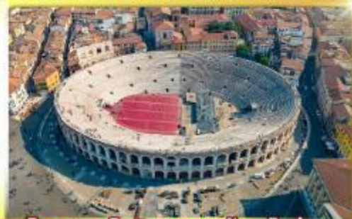
โรงละครโรมันกลางจัหวโรม่า