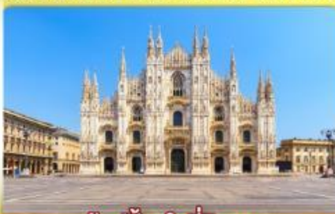
ซอปป์งใจที่มิลาน