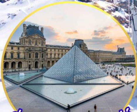
ถ่ายรูปคู่พีร์กันท์ลูฟท์