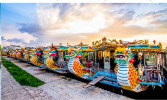
ล่องเรือมังกร