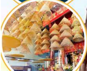
ไหว้พระวัดดัง