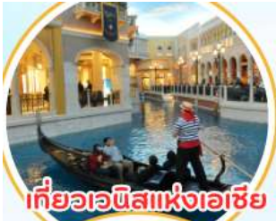
เที่ยวเวนิสแห่งเอเชีย