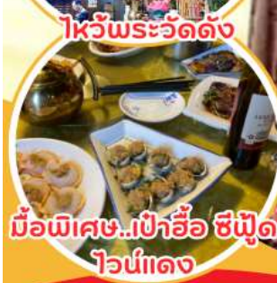
มือพิเศษ...เป่าฮ้อ ซีฟูด ไวน์แดง