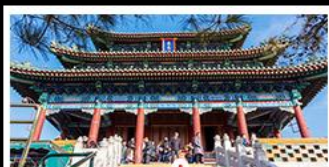
สวนจิ่งอัน