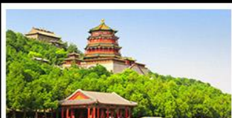
พระราชวังฤดูร้อนอีเหอหยวน

กำแพงเมืองจีนด่านจวิรงกวน - พระราชวังฤดูร้อนอีเหอหยวน สวนจิ่งอัน - วัดลามะ - ไหม่หลงร้านช้อปปิ้ง - โรงแรม 4 ดาว บ๊อฟฟิศ เปิดปักกิ่ง สุกี่มองโก MICHELIN GUIDE ร้าน TAO TAO JU