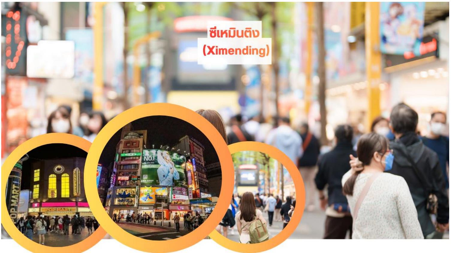
ซีเหมินติง (Ximending)

ปิดท้ายวันด้วยการเดินทางสู่ กรุงไทเป หลังจากนั้นนำท่านเดินเล่นที่ ย่านซีเหมินติง (Ximending) – ศูนย์รวมแฟชั่น และวัฒนธรรมสตรีทฟู้ด ย่านซีเหมินติง ตั้งอยู่ใจกลางกรุงไทเป เป็นพื้นที่ที่มีคุณค่าทางวัฒนธรรมและสังคมเมือง ย่านพาณิชย์กรรมและวัฒนธรรมร่วมสมัย ของไต้หวัน มีประวัติศาสตร์ยาวนานตั้งแต่สมัยญี่ปุ่นปกครองทำให้สถาปัตยกรรม และสภาพแวดล้อมสะท้อนถึงความหลากหลายทางวัฒนธรรมและพัฒนาการทางเศรษฐกิจของเมือง นอกจากนี้ยังเป็น ศูนย์กลางของ แฟชั่นสตรีทและศิลปะร่วมสมัย ที่ดึงดูดนักศึกษาและวัยรุ่นให้เข้ามาแลกเปลี่ยนวัฒนธรรมและไอเดียใหม่ ๆ แหล่งช้อปปิ้งและสตรีทฟู้ดยอดนิยม เพลิดเพลินกับการเลือกซื้อสินค้าแฟชั่นทันสมัย, ของฝากเก๋ ๆ และเครื่องสำอาง แปรนต์ท้องถิ่น พร้อมลิ้มรส อาหารสตรีทฟู้ดชื่อดังของไต้หวัน เช่น ของทอด ขนมหวาน และเครื่องดื่มท้องถิ่น บรรยากาศคึกคักยามค่ำคืน เสียงดนตรีและแสงไฟนีออน ทำให้ซีเหมินติงเป็น จุดหมายสุดสนุกที่รวมแฟชั่น อาหาร และ วัฒนธรรมเข้าด้วยกัน ความมีชีวิตชีวา