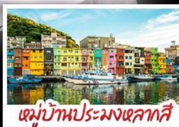
หมู่บ้านประมงเหลากสี