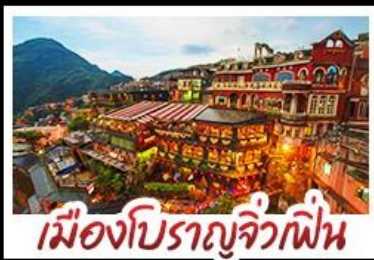
เมืองโบราณจีวเฟิน