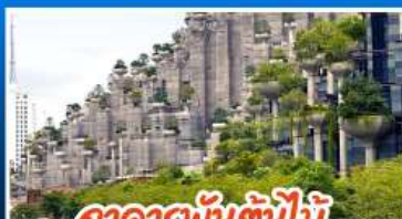
อาคารพันต้นไม้มิ่ TIAN AN 1000 TREES