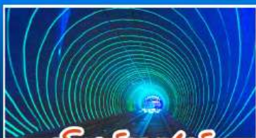
อิมจินคเเลเซอร์