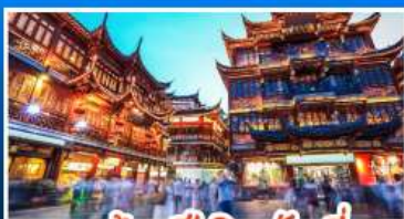
ตลาดร้อยปีฉางชิ่งเหมียว