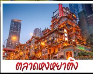
ตลาดงเซาตัง