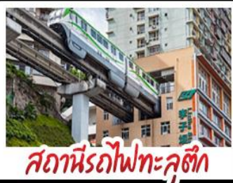
สถานีรถไฟทะเลลึก

งซิ่ง - อุโมงค์ - หงหยาดัง - อุทยานเขานางฟ้าวงซิ่ง สถานีรถไฟทะเลลึก - หลุมฟ้าสามสะพานสวรรค์