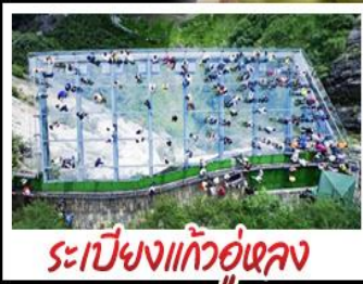
ระเบียงแก้วอุโมงค์