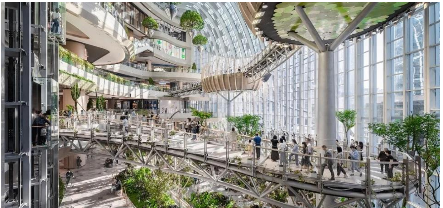
บ่าย นำท่านเช็คคอน ณ ห้าง THE RING MALL นิยามใหม่ของศูนย์การค้า ที่ซึ่งจินตนาการและความล้ำสมัยได้ก้าวไปอีกขั้น ถึงขั้นที่ท่านสามารถเดินช้อปปิ้งไปพร้อมกับการชมความยิ่งใหญ่ของธรรมชาติ หัวใจของสถานที่แห่งนี้คือ "ป่าแนวตั้งในร่มขนาดมหึมา" ที่สูงตระหง่านถึง 42 เมตรใจกลางตัวอาคาร จินตนาการถึงการเดินอยู่บนสะพานแขวนที่ทอดผ่านม่านน้ำตกซึ่งไหลลงมาจากชั้นบนสุด สองข้างทางคือพืชพรรณเขตร้อนนานาชนิดที่เขียวชอุ่มราวกับป่าดิบชื้นจริงๆ แสงธรรมชาติที่ส่องลงมาจากหลังคากระจกยิ่งทำให้ที่นี่ดู