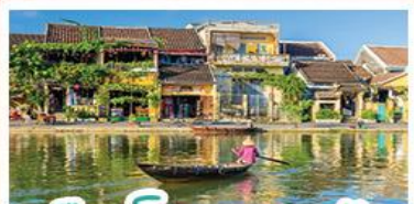
เมืองโบราณเฮอฮอัน

! พักบนเขาน่าฮิลล์ 1 คืน ! สัมผัสอากาศเย็นตลอดปี สตรีตฝรั่งเศสสุดคลาสสิก - นั่งกระเช้ายาวที่สุด สู่นานาฮิลล์ สนุกสุดมันส์ไปกับสวนสนุก The Fantasy Park มีบริการเช่าแม่ทวนอิมองค์ใหญ่ที่สุดของเมืองดานัง - เช็กอินเมืองมรดกโลกฮอยอัน - สนุกสนานไปกับกิจกรรม!!นั่งเรือกระดิง หมู่บ้านกัมทาน เช็กอินร้านกาแฟ SON TRA MARINA CAFE - ไม่หลงร้านช้อปปิ้ง - อิ่มอร่อยกับบุฟเฟ่ต์นานาชาติ , หม้อไฟซีฟู้ด