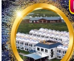
ที่พักสไตล์กรังจ์