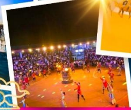
งานเลี้ยงรอบกองไฟ