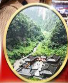
อุทยานหลุมฟ้า สะพานสวรรค์