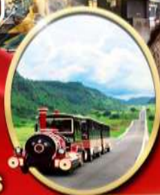
อุทยานเขนางฟ้า