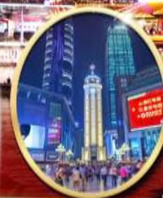
ถนนคนเดินเจี๋ยฟางเป่ย์