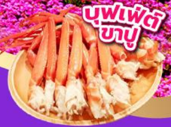
บุฟเฟ่ต์ ขาปู