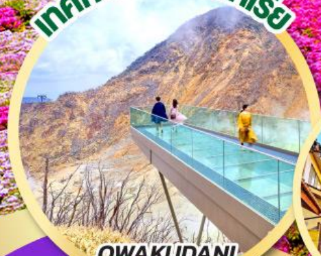
OWAKUDANI EARTH VALLEY