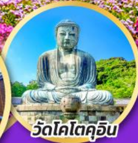
วัดโคโตคุอิน