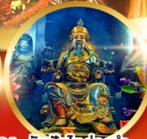
วัดปักไต้ฮ้องอำ

ขอพรความสำเร็จ การงาน ขอพรความสำเร็จในชีวิตการงาน