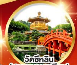
วัดซีหลิน (สวนหนานเท่ลิย)