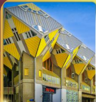
บ้านลูกเต๋า โคกคูบัส

“ล่องเรือหลังคากระจก” ชมกรุงอัมสเตอร์ดัม