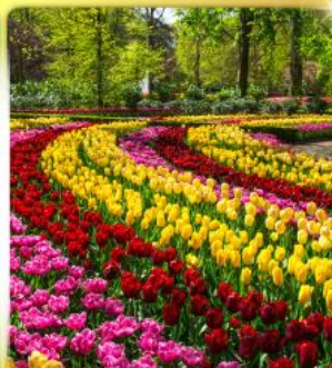
เทศกาลดอกไม้เคอเคนฮอฟ

เดินทาง 8 วัน 5 คืน 05-12, 07-14 เม.ย. 69 27 เม.ย. – 04 พ.ค. 69 06-13 พ.ค. 69 27 พ.ค. – 03 มิ.ย. 69 17-24 มิ.ย. 69