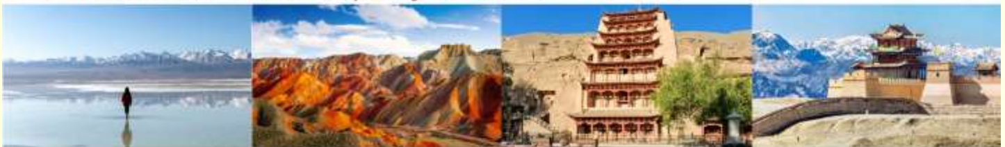
ทะเลสาบชิงไห่