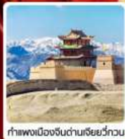
กำแพงเมืองจีนด่านเสี่ยววีกวน

• ไฮไลท์...เส้นทางสายไหม ชมสระบัววังพระจันทร์ ทะเลทรายหมีงาช้าง กำแพงเมืองจีนด่านสุดท้าย "เจียยวีกวน" มรดกโลกภูเขาสายรุ้งจางเย่