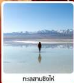
ทะเลสาบชิงไห่