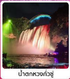
น้ำตกหวงกั๋วซู่