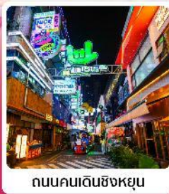
ถนนคนเดินซิงหยุน

• โฮเทล ส่วนชาคุระผิงปา หนึ่งในสถานที่ชมดอกชาคุระที่ใหญ่ที่สุดในโลก น้ำตกสวยระดับ 5A น้ำตกหวงกั๋วซู่ หมู่บ้านจีนโบราณ วูเจียงจ้าย