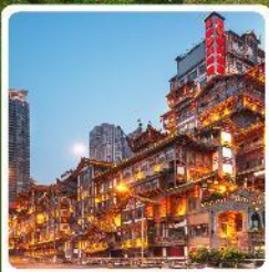
หงหยาดิง