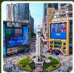
ถนนเจียฟางเป่ย์