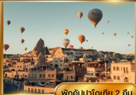
พิกคิปปาโดเกีย 2 คืน