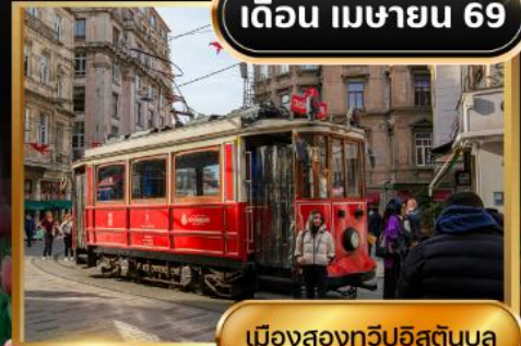
เมืองสองทวีปอิสตันบูล