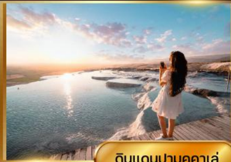
ดินแดนปามุคคาเล่