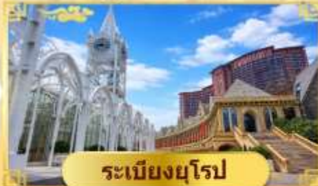
ระเบียบยุโรป