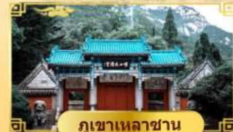
ภูเขาเหลาซาน