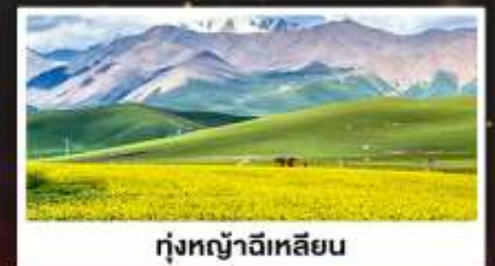
ทุ่งหญ้าฉีเหลียน