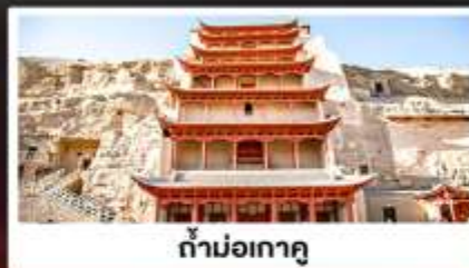
ถ้ำม่อเกาตุ