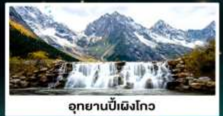
อุทยานปี่ฝงโกว