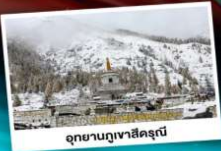
อุทยานกุเวาสีดรุณี