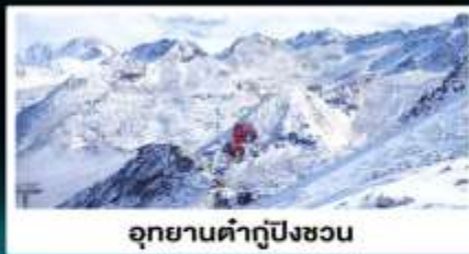
อุทยานคำกู่ปิงซอน