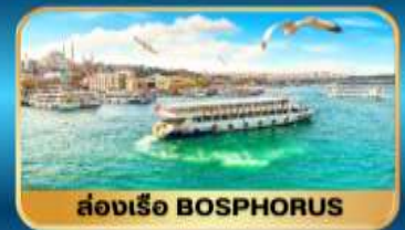
ล่องเรือ BOSPHORUS