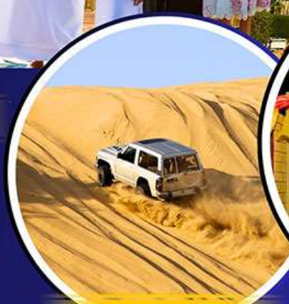
รถเช่าราย 4X4

เริ่มต้น 10 ท่าน คอนเฟิร์มเดินทาง 37,988.- มกราคม - พฤษภาคม 69