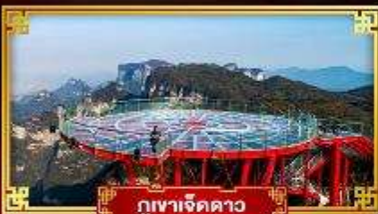
กุเขาเจ็ดดาว