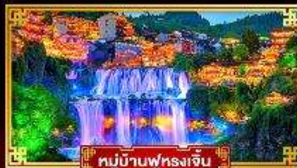
หมู่บ้านฟุรงเจิ้น