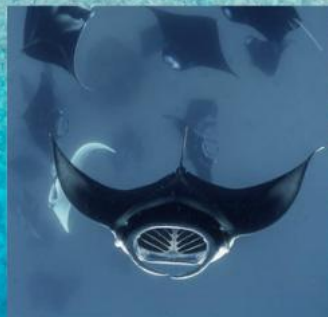
Manta Ray Snorkeling