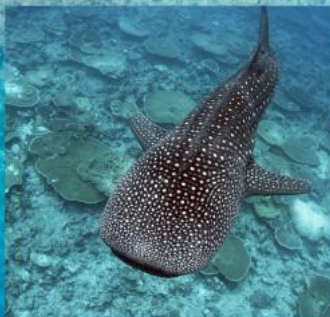
Whale Shark Snorkeling